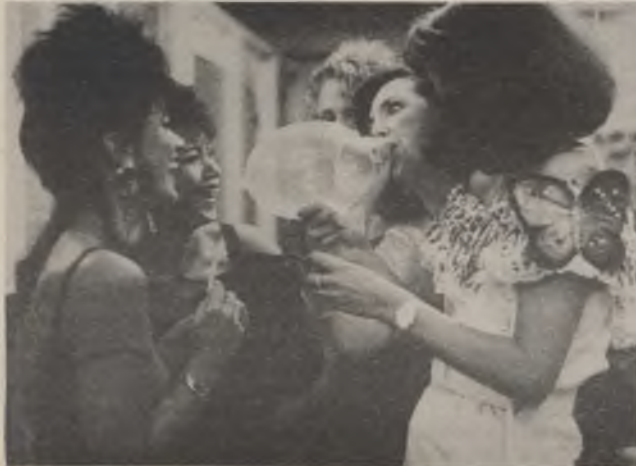
studente geneeskunde in de spannende, surrealistische thriller 'Flatliners'.

Op 13 maart gaat haar nieuwste film 'Sleeping with the Enemy' in Belgische première. Hierin speelt ze de mooie Laura, die drie jaar gehuwd is met de rijke Martin. Ze bewonen een weelderige villa met zicht op zee. Ieder detail van het wit-zwarte interieur wijst op een bijna ziekelijke zin voor orde en netheid. Voor Martin is dit strenge en bijna abstracte milieu zoals een schaakspel zijn heiligdom; voor Laura is het een gevangenis en nachtmerrie. Zij lijkt de gelukkige, liefhebbende en onderdanige vrouw, maar in werkelijkheid wacht ze slechts op een gelegenheid om te ontsnappen aan de aanvallen van geweld en jaloezie van Martin. Tijdens een nachtelijke boottocht op zee maakt Laura gebruik van een plotse storm om in de golven te