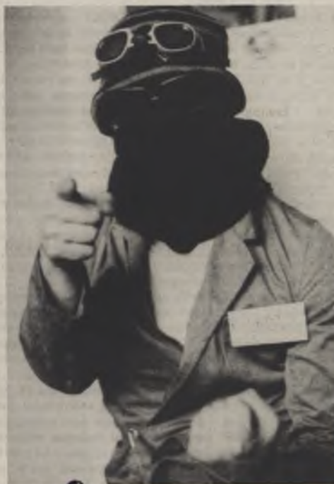
de verantwoordelijke uitgever needs you!

Kijk, nu even serieus. Wij zijn een studentenblad met kloden aan het lijf en, mits enige medewerkers, kunnen wij ondanks veel praktische problemen nieuws brengen en dankzij de sociale sektor wordt dit ons financieel mogelijk gemaakt. De V.U.B.-studenten mogen deze kans om studentennieuws te brengen niet laten liggen :