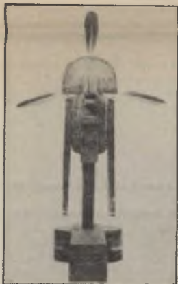
Opgedragen aan Red Cloud, 1976

Indianen-poppen opgebouwd uit gaas, papier, jutte - verinkt - marteling reflecterend, zijn een reactie van Van Breedam op wat overblijft en nog steeds gebeurt met de Indianen in Noord- en Zuid-Amerika en elders: uitroeiing, miskenning, achteruitstelling. Ook de mens van het Westen, in zijn steeds krimpende leefwereld, ontkomt niet aan het kritisch oog van de kunstenaar.