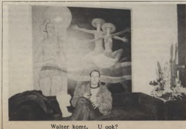
Walter komt. U ook?

Onderandere! Want terwijl u lustig vredesbetogertje speelt kan u inderdaad glimpen opvangen van plaatselijke (?) en minder plaatselijke artiesten. Zoals daar zijn, tussen 15 en 17 uur: de Libanese zanger Khalif, de Nicaraguaanse groep Godoy, de Afrikaanse zangeres M. Nhlanhla, de Russische groep Rock Atelier en, wie gesagd, Elisa Waut (hoera!). Moge de weergoden iedereen gunstig gezind zijn, bijgevolg!