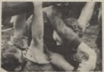
Standje 44 gedemonstreerd