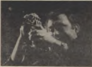
Het Kärtner Jazz Ensemble

Dinsdag 20 oktober '87 - 20u30 Kultuurkafée VUB - toegang gratis