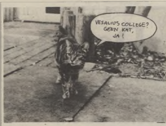
Dit is niet zomaar een onderschrift, maar een onderschrift bij een foto van Vesalius-studenten.

The Dutch part of this article says that Vesalius is a lot more expensive than e.g.