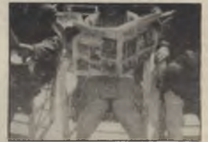
A propos de Nice