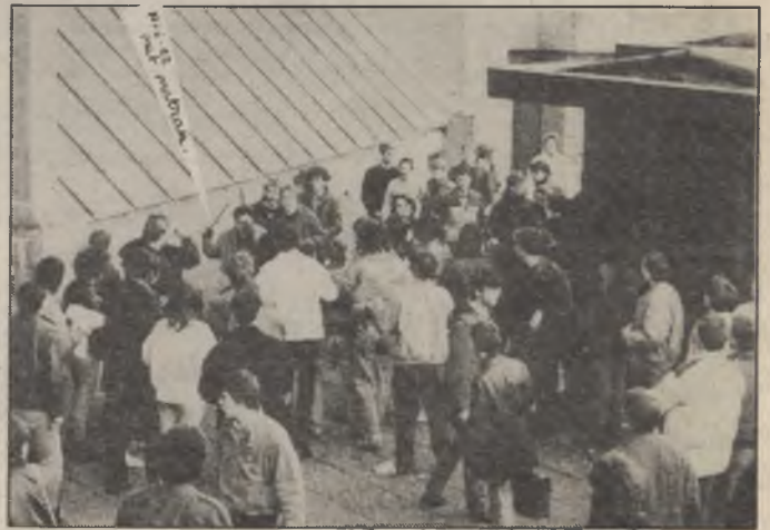
met beest van N.S.V., 3 jaar geleden.

Voor dit jaar hebben we het ook weer gehad! Naar jaarlijkse gewoonte bezocht een N.S.V.-delegatie (28 man zonder paardekop) de V.U.B.-kampus. De "Vlaamse dapperen (sic)" van de Nationalistische Studentenvereniging deelden hun tijdschrift "Kraaiepot" aan de ingang van het resto uit. Helaas (sic), hun plannetje viel (letterlijk) in het water. Na een spuitserenade, over-en-weer-gebruil en effectief agressief geknuffel — cfr. de schrammen, blauwe plekken en iets zwaardere kneuzingen door sommige studenten opgelopen — werden ze van het V.U.B.-terrein afgedreven (ook al een jaarlijks evenement). Diegenen die bij de N.S.V. klok noch klepel zien hangen, verwonderen zich wellicht over onze "gastvrijheid" t.o.v. deze mini-privémilitie. Ze deelden immers slechts pamfletjes uit en, als wij dit niet verhinderd hadden, waren er wellicht ook geen rellen geweest. Waarom dan niet laten betijen?