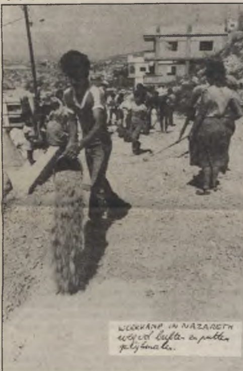
WERKKAMP IN NAZARETH wereld kulturen en politiek gelijkmaken.