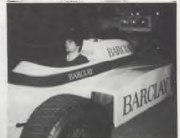
piloot een gratis Polaroidfoto gemaakt. Reuzeleuk.

vliegtuigjes. Zeer leuk en leerrijk allemaal en niet alleen IBM kan een tentoonstelling estietisch verantwoord inrichten, ook het HILOK. Het allerleukste was echter wel de stand van Barclay, u weet wel, dat sigarettenmerk dat de formule 1-ploeg van o.a. Thierry Boutsen sponsort. De bezoekers werden aan de stand opgevangen door twee leuke pitspoezen, zo van Franchorchamps weggeplukt, dan mochten ze plaats nemen achter het stuur van een bijna echte F 1-bolide en beginnen te rijden. Niet echt rijden maar met het stuur van de auto een levensgroot videospel voor zijn neus bedienen, op de koop toe werd er van iedere onvervaard