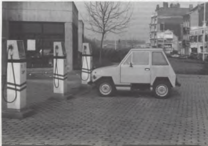
Alternatieve scheurders: hier uw milieuvriendelijke droom