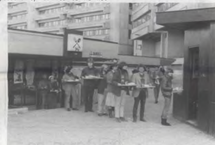
In de richting van de esplanade ter hoogte van het ASLK-kantoor tijdelijke filevorming wegens dienbladpsychose.

Tot zover de historie van de dienbladen. Vraag blijft natuurlijk of het hierbij blijven zal. Nogal wat mensen binnen de Sociale Raad, waaronder de voorzitter, staan alvast niet afkerig tegenover reclame op de campus. De kosten stijgen maar steeds, terwijl de inkomsten gelijk blijven of misschien zullen dalen. Door verdere invoering van reclame kunnen mogelijk nieuwe prijsstijgingen vermeden worden. 'Als er door publiciteit op de campus een aantal studenten meer kunnen studeren op de unief, moeten we dat toestaan', zegt men. Het doel heiligt dus de middelen.